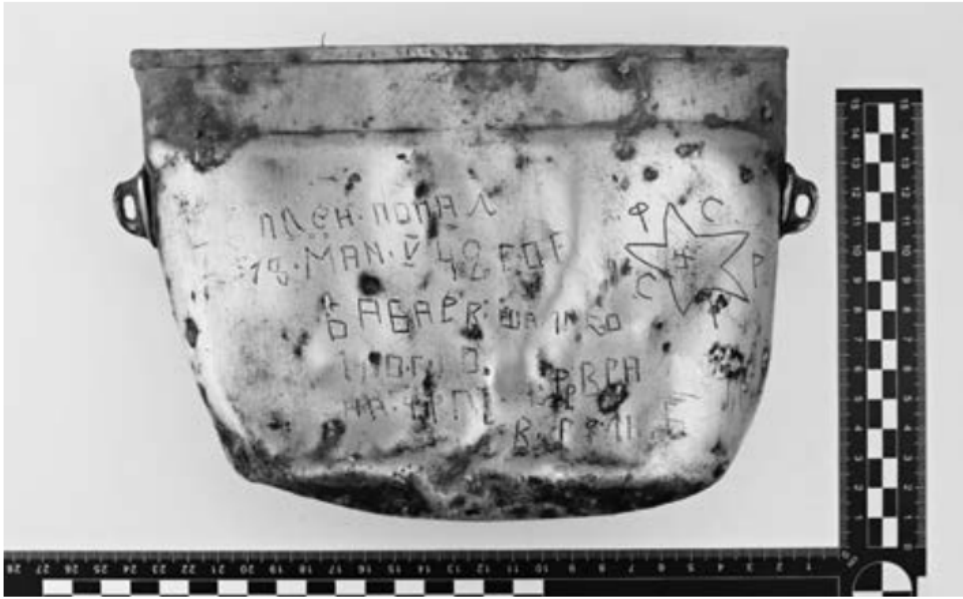
Menażka rytowana nazwiskiem Szaliko Babajew

Możliwości takiej nie daje najliczniejsza grupa artefaktów pozyskanych w wyniku powierzchniowych prac poszukiwawczych, którą stanowią drobne elementy militarnej garderoby – guziki mundurowe. Ich różnorodność jest jednak doskonałym – choć wciąż niepełnym i wymagającym krytycznej analizy – odzwierciedleniem wielonarodowościowego charakteru jenieckiego kompleksu Lamsdorf. W ośmiu obozowych barakach, które stanowią przecież tylko niewielką część poobozowego terenu, zalegały guziki wojskowe dziewięciu europejskich armii, których żołnierze trafili do niewoli Wehrmachtu.