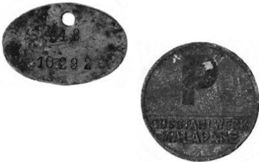
Jeniecki znak tożsamości i przepustka pracownicza na teren huty Malapanne