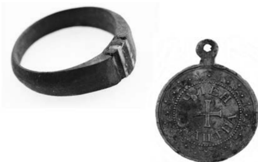
Sygnet wykonany w obozie i medalion religijny