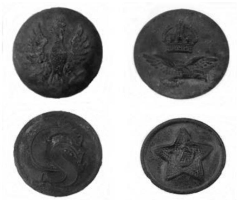
Guziki mundurowe armii: polskiej, brytyjskiej, czeskosłowackiej, radzieckiej

Ostatnim rodzajem odnalezionych guzików (ok. 130 obiektów) są te wykorzystywane do oporządzenia żołnierskiego takiego jak: chlebak, plecak, bielizna. Różne armie europejskie stosowały podobne ich wzory, stąd przypisanie ich do poszczególnych wojsk jest zadaniem utrudnionym. Należy również odnotować obecność na badanym terenie guzików armii pruskiej i niemieckiej. Jest to sporych rozmiarów grupa licząca ok. 150 obiektów. W zdecydowanej większości są to guziki ogólnowojskowe, których awers ma charakterystyczne groszkowane tło. Produkowane były na potrzeby Wehrmachtu w latach 1928–1945.