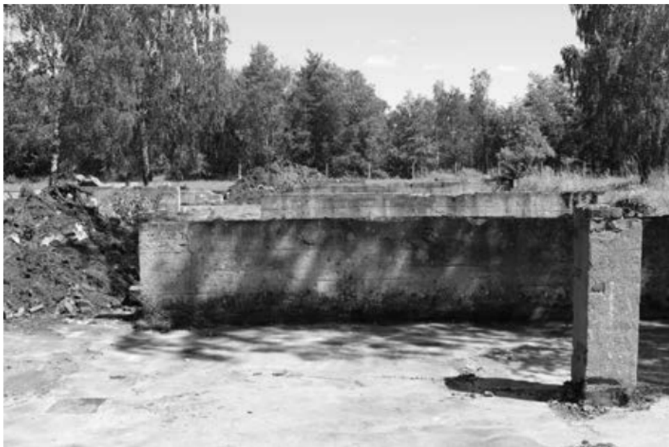
Pozostałości baraku VIII, segment 1 z widocznym fragmentarycznie zachowanym słupem podporowym

we wskazanych szynkach i karczmach 22 . Ten konkretny mógł być wymieniony na szklanicę piwa w gospodzie Wilhelma Reichela w Maiach 23 , o czym świadczy umieszczony na nim zapis Gut für ein Glas Bier . Trudno dziś ustalić, jak i kiedy żeton trafił do Lamsdorf, gdzie „wypadł z kieszeni” niemieckiego żołnierza. Z całą pewnością niemiecka restauracja W. Reichela prosperowała już w pierwszych latach XX w. 24