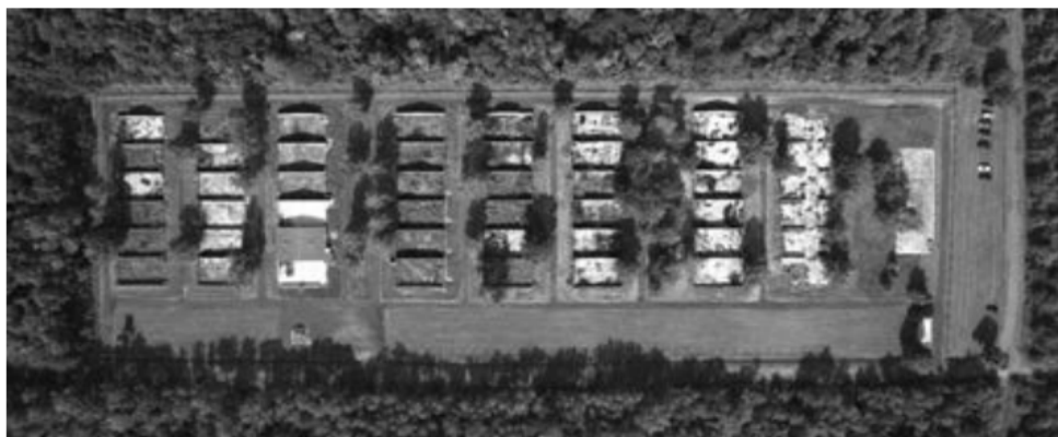
Sektory XIV, XV i XVI byłego Stalagu 318/VIII F (344) Lamsdorf (widok z góry) przed rozpoczęciem prac budowlano-konserwatorskich w 2020 r.